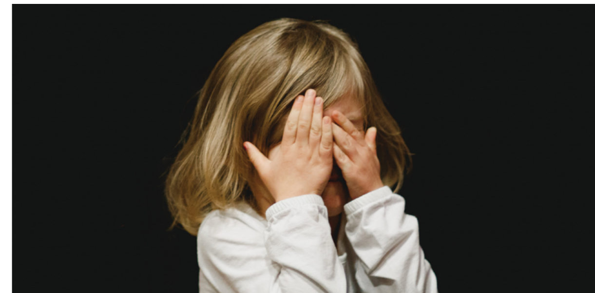
Vertrauen kann schnell verschwinden, besonders im Krieg. Darüber forscht das ZfV

25 Jahre Zentrum für Vertrauensforschung in Vechta