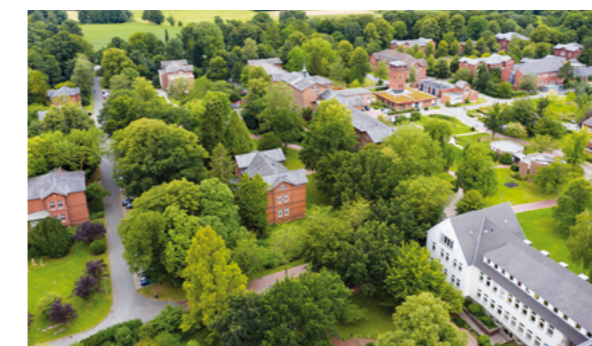
Luftaufnahme der heutigen Karl-Jaspers-Klinik

Forschungsprojekt mit regionalem Bezug startet an der Uni Vechta