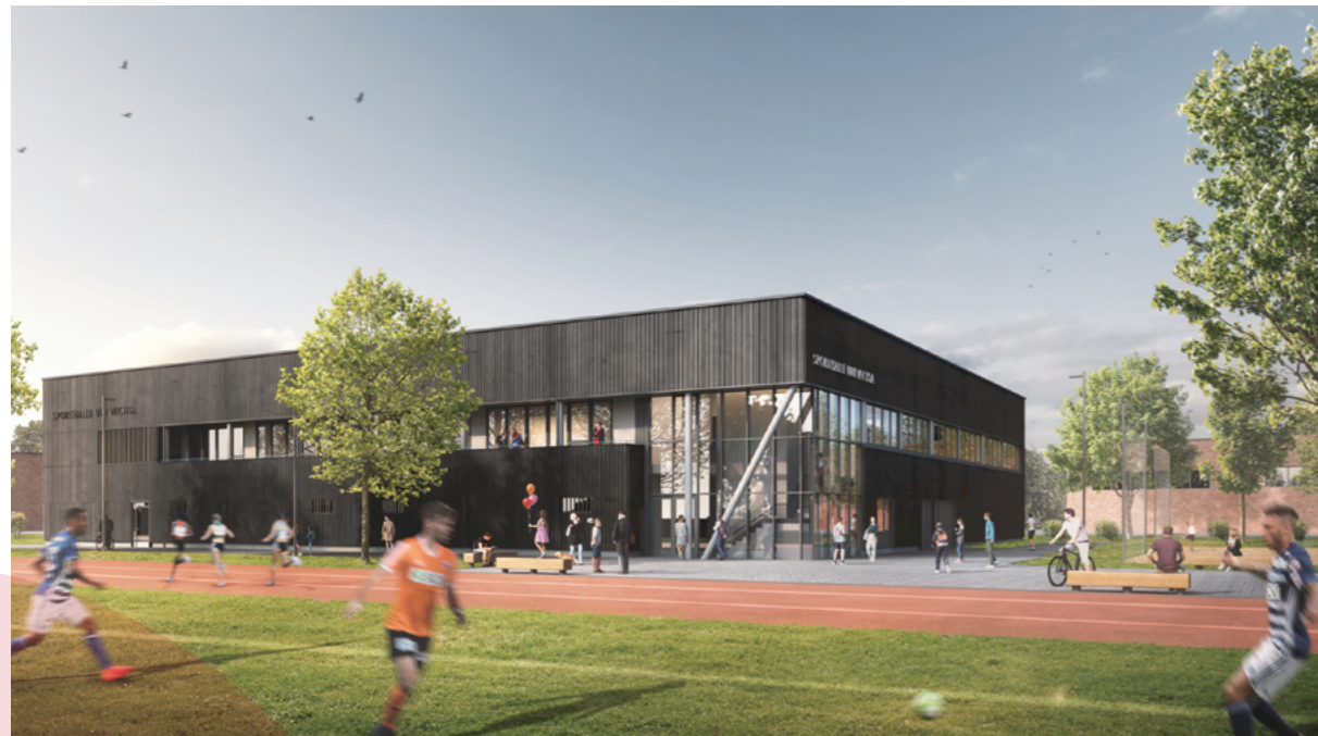
So soll sie aussehen: die neue Sporthalle der Universität Vechta, entworfen vom Architekturbüro flatauarchitekten PartG mbB

Die Universität Vechta baut ihr Sport-Angebot über die Jahre aus