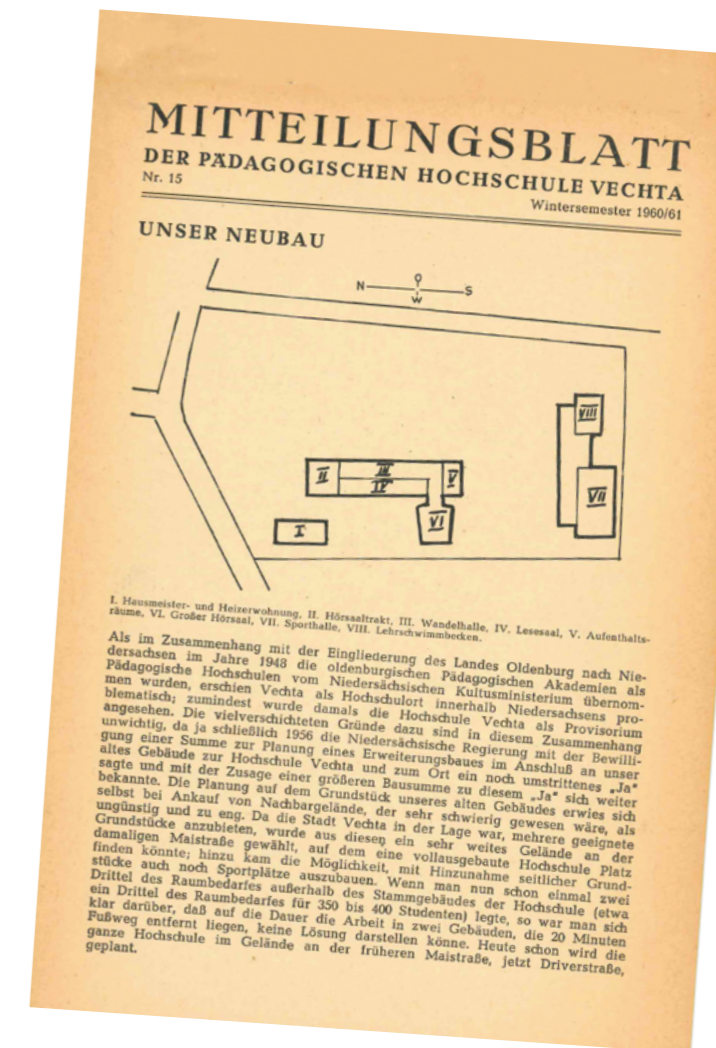
Mitteilungsblatt von 1961 mit der Planung der damaligen Neubauten: I. Hausmeister- und Heizerwohnung, II. Hörsaaltrakt, III. Wandelhalle, IV. Lesesaal, V. Aufenthaltsräume, VI. Großer Hörsaal, VII. Sporthalle, VIII. Lehrschwimmbecken.

„In der langen Coronapause verließen viele der Übungsleiter*innen die Universität und es rückten keine neuen nach“, so der langjährige Mitarbeiter der Universität Vechta. Wer Interesse habe, einen Kurs anzubieten, könne sich sehr gern bei ihm melden. „Mit dem Bau der neuen Sporthalle kommt man jetzt endlich in den Genuss, die großen Sportspiele in der eigenen Halle durchführen zu können, zusätzliche Kurse anzubieten, Turniere zu organisieren, Sportauftritte mit Zuschauern durchführen zu können und einen Ort der Begegnung zu schaffen“, freut sich Telsemeyer. uni-vechta.de/zentrum-fuer-hochschulsport