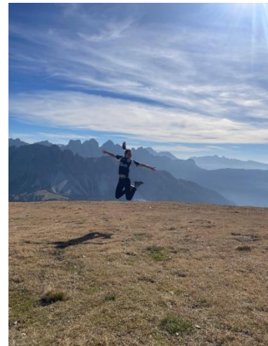
Wanderung auf der Plose (Brixen)