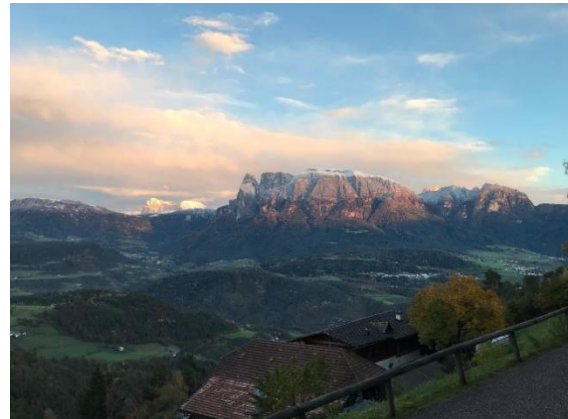
Blick von Oberbozen auf den Schlern

Ende September habe ich mich auf die Reise nach Südtirol begeben. Nach einigen Tränen ging es dann trotzdem mit voller Vorfreude im Gepäck mit dem Zug über Düsseldorf und München innerhalb von 12 Stunden nach Bozen. Vom Bahnhof in Bozen musste ich allerdings noch mit Bus zu meiner