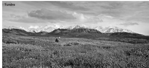
Bild 1 Im Norden Norwegens bei Finja